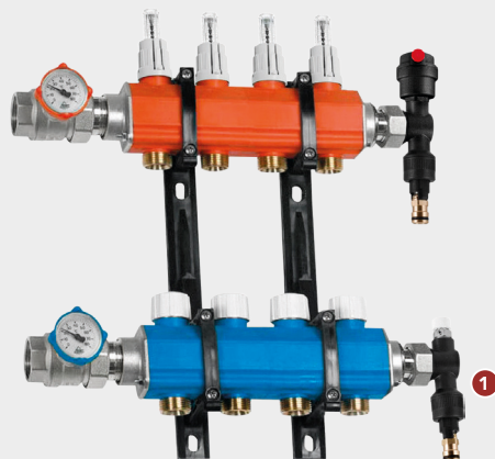
Kit collettori anticondensa