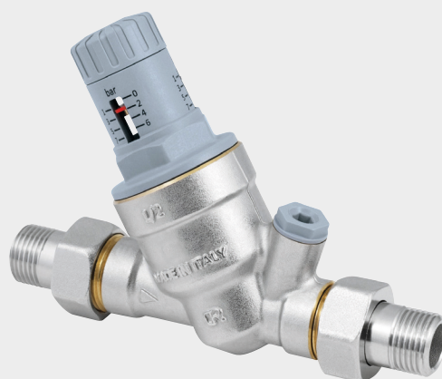
RINOXPLUS SMART M