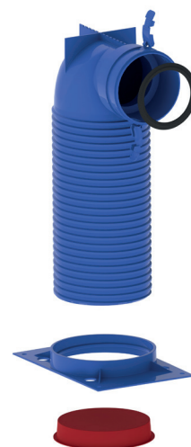
1x tappo DN125 e 1x o-ring DN90 compresi nella fornitura

Filtri inseribili all'interno sono disponibili in opzione