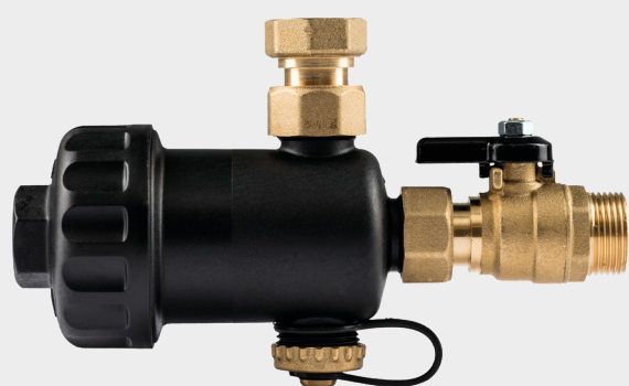
MG1 Filtro defangatore magnetico