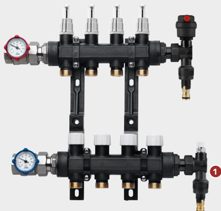
Kit collettori compatti in tecnopolimero