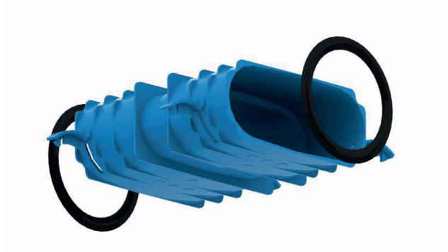
2x o-rings per tubo corrugato compresi nella fornitura

Ulteriori clip di fissaggio per chiusura meccanica degli accoppiamenti ai tubi sulle estremità